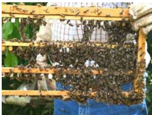
Εικόνα 4. Κανονικό πλαίσιο που συγκρατεί τρεις πήχεις με βασιλικά κελιά.

Τα βασιλοκύτταρα, για να εισαχθούν στο κέντρο της γονοφωλιάς τοποθετούνται πάνω σε πήχεις οι οποίοι εφαρμόζουν σε κανονικό πλαίσιο Ένα κανονικό πλαίσιο μπορεί να δεχτεί τρία πηχάκια με απόσταση 5 cm το ένα από το άλλο. Σε κάθε πηχάκι τοποθετούνται 20 περίπου κελιά ( Εικ. 4 ).