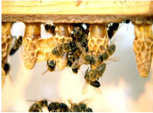
Εικόνα 1. Βασιλικά κελιά ομοιόμορφα σε μέγεθος με ανάγλυφη επιφάνεια.

Τις πρώτες ημέρες, μετά την έξοδό της από το κελί, η βασίλισσα δέχεται τη φροντίδα των εργατριών μέσα στο κυψελίδιο μέχρι να ωριμάσει αναπαραγωγικά. Είναι πολύ σημαντικό το κυψελίδιο να έχει αρκετή τροφή (μέλι και γύρη) καθώς και αρκετό πληθυσμό ώστε να έχουν τη δυνατότητα οι εργάτριες να ρυθμίζουν τη θερμοκρασία του και να τροφοδοτούν επαρκώς τη βασίλισσα