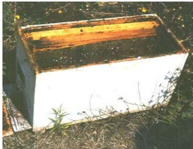
Εικόνα 3. Αριστερά, τριπλοκυψελίδιο και δεξιά, κυψελίδιο 5 πλαισίων τύπου Χόφμαν των κανονικών κυψελών.

Τα κυψελίδια λέγονται αλλιώς παραφυάδες και στα λατινικά nuclei (πυρήνες). Υπάρχουν πάρα πολλοί τύποι κυψελιδίων και ως προς το μέγεθος, αλλά και ως προς το σχήμα. Ο σκοπός για τον οποίο προορίζονται καθορίζει και το μέγεθος του κυψελιδίου. Όσο είναι δυνατόν θα πρέπει τα κυψελίδια και όλα τα υλικά που