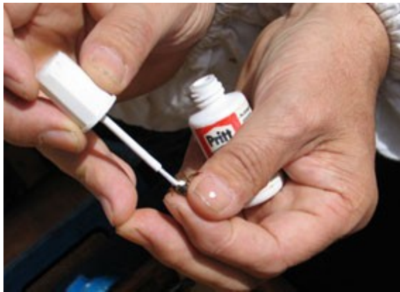
Εικόνα 10. Τοποθέτηση χρώματος επάνω στο θώρακά της γονιμοποιημένης βασίλισσας.

Κίτρινο χρώμα για τα έτη που λήγουν σε 2 ή 7. Κόκκινο χρώμα για τα έτη που λήγουν σε 3 ή 8. Πράσινο χρώμα για τα έτη που λήγουν σε 4 ή 9.