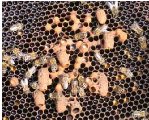
Εικόνα 7. Βασιλικά κελιά διάσωσης συνήθως αμφιβόλου ποιότητας για παραγωγή βασιλισσών.

Ένα μελίσσι, όταν μένει ορφανό, χτίζει βασιλικά κελιά διάσωσης. Τα κελιά αυτά είναι συνήθως χτισμένα στο κέντρο της κηρήθρας. Όταν το μελίσσι είναι δυνατό, η βασίλισσα που χάθηκε από καλό γενετικό υλικό και η ανθοφορία έξω καλή, τότε οι βασίλισσες που θα παραχθούν είναι συνήθως καλής ποιότητας αλλά αυτό δε συμβαίνει συχνά (Εικ. 7).