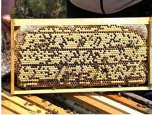
Εικόνα 6. Κηρήθρα με κηφηνόγονο με περισσότερα από 3.000 κελιά που έχουν εκτραφεί σε δυνατό μελίσσι.

Ο καλύτερος τρόπος απόκτησης πολλών κηφήνων είναι η τοποθέτηση κηφηνοκηρήθρας στο κέντρο της γονοφωλιάς μελισσιού που έχει επιλεγμένη βασίλισσα. Για την απόκτηση ώριμων κηφήνων απαιτούνται περίπου 35 μέρες από την τοποθέτηση της κηρήθρας μέσα στο μελίσσι, δηλαδή 24 μέρες για την εκκόλαψή τους από κελί και 10 περίπου μέρες για την ωρίμανσή τους. Το μελίσσι εκτροφής κηφήνων πρέπει να είναι δυνατό και να τροφοδοτείται με σιρόπι και γύρη, εκτός αν οι μέλισσες φέρνουν πολύ νέκταρ και γύρη. Από την επιφάνεια ενός πλαισίου μπορούν να εκκολαφθούν περίπου 3.000 κηφήνες, που είναι αρκετοί για 200 βασίλισσες ( Εικ. 6 ).