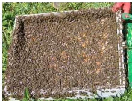
Εικόνα 2. Η δύναμη του μελισσιού εκτροφής βασιλικών κελιών είναι καθοριστικής σημασίας.