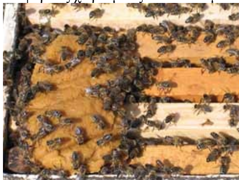
Εικόνα 8. Η τροφοδότηση με υποκατάστατο γύρης είναι πολύ σημαντική για την επιτυχία της βασιλοτροφίας.

δ) Περιορίζουμε τις μέλισσες στον κάτω μόνο όροφο με 9 συνολικά πλαίσια. Προτιμούμε να έχουμε 9 πλαίσια και όχι 10, γιατί δίνουμε έτσι στις πολλές μέλισσες που υπάρχουν περισσότερο ελεύθερο χώρο, για να κινούνται και επίσης κατά τους διάφορους χειρισμούς σκοτώνουμε πολύ πιο λίγες μέλισσες.