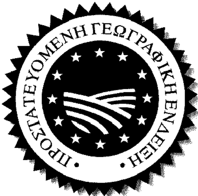
ΠΡΟΣΤΑΤΕΥΟΜΕΝΗ ΓΕΩΓΡΑΦΙΚΗ ΕΝΔΕΙΞΗ