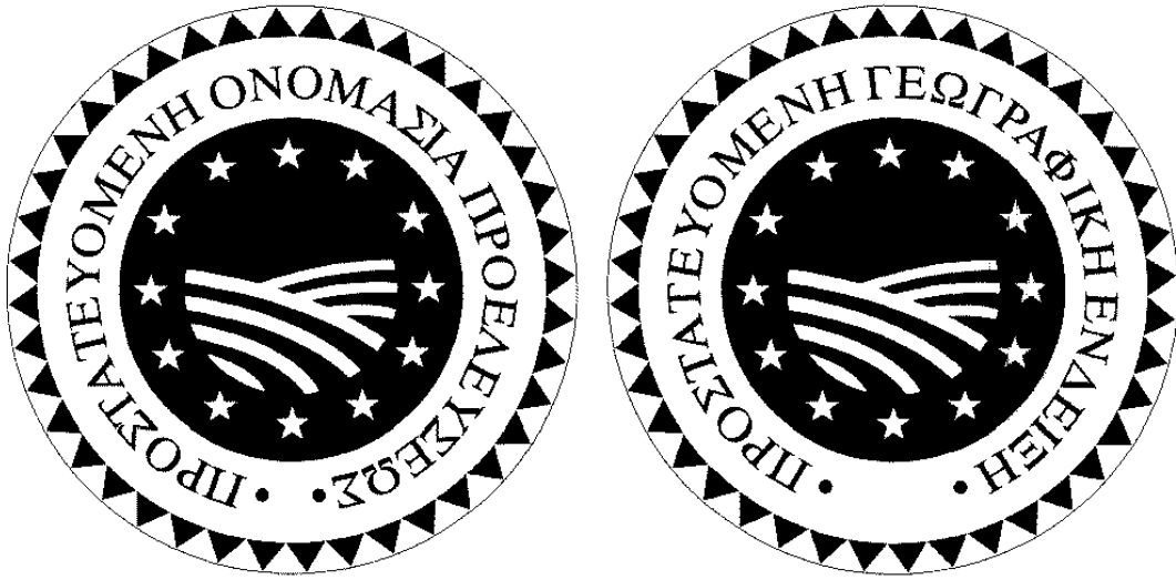
ΛΟΓΟΤΥΠΟ ΜΕ ΕΓΧΡΩΜΟ ΦΟΝΤΟ

Αν το λογότυπο χρησιμοποιείται έγχρωμο σε φόντο που δυσκολεύει την ανάγνωσή του, θα χρησιμοποιηθεί ένας κύκλος γύρω-γύρω στο λογότυπο για μεγαλύτερη αντίθεση σε σχέση με το χρώμα φόντου.