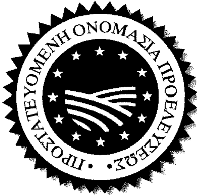
ΠΡΟΣΤΑΤΕΥΟΜΕΝΗ ΟΝΟΜΑΣΙΑ ΠΡΟΕΛΕΥΣΕΩΣ

Ενσωματώθηκε μια γραφική αναπαράσταση των αυλακίων οργωμένου χωραφιού για να γίνει αναφορά στον τόπο καταγωγής των προϊόντων που φέρουν τα λογότυπα αυτά.